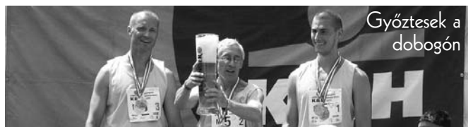
Győztesek a dobogón

További szponzorok és támogatók segítségét is köszönettel és szívesen vesszük!