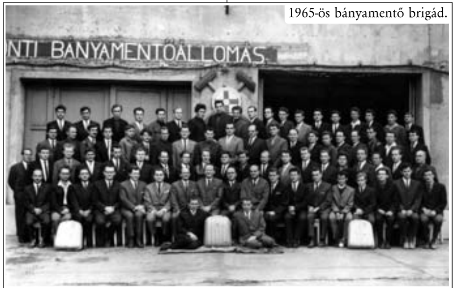
1965-ös bányamentő brigád.

kenykedett itt. Az alapvágaton kigyuladt a szállítószalag és a fejtésben olyan mennyiségű szénmonoxid koncentráldott, hogy sajnos 6 bányász társunk aki nem tudott idejében kimenekülni, megfulladt. Mi a 2. biztosító rajban voltunk, oltóanyagot, ventilátort és egyéb mentési agyagok biztosítása volt a feladatunk. A gátolási munkálatokban is segédkeztünk, sikerült gyorsan lokalizálnunk a tüzet.