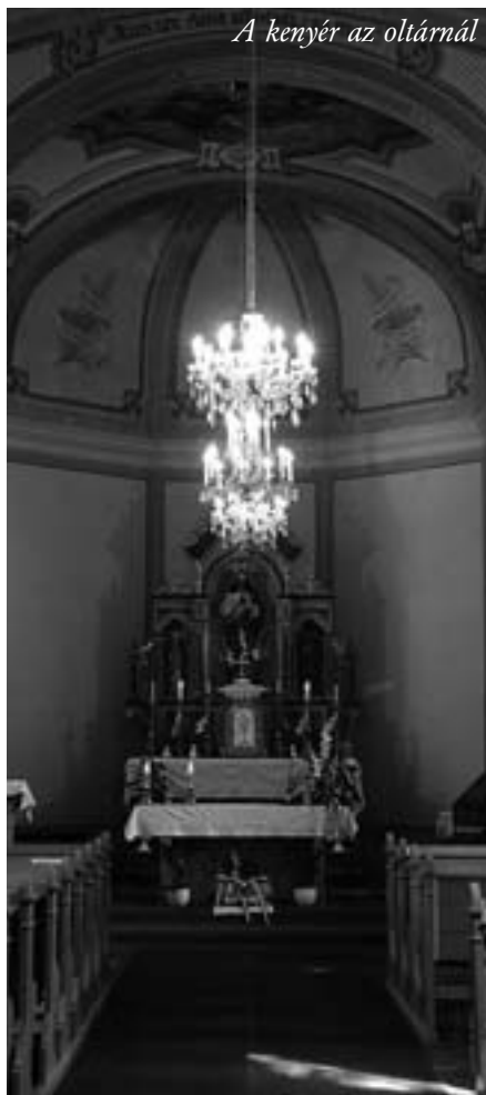
A kenyér az oltárnál