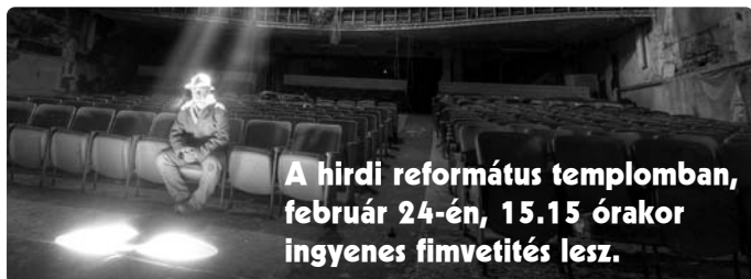
A hirdi református templomban, február 24-én, 15.15 órakor ingyenes fimvetítés lesz.

A MEGFEJTÉSEKET VÁRJUK: a mihir2007@freemail.hu e-mail címen, vagy a hirdi-somogyi-vasasi patikában, telefon: 72/537-033