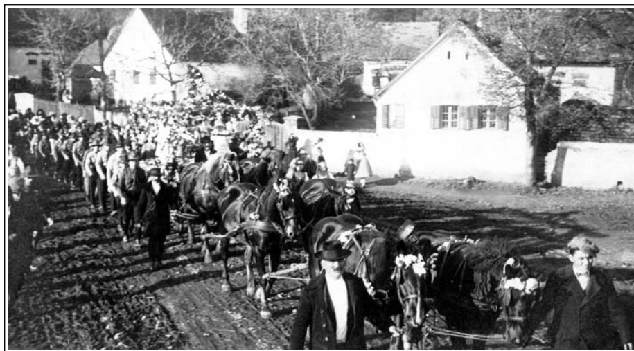
A kérdés: Mikor és hol készült a kép, mit ábrázol?